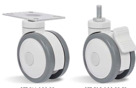
GZT PLA 100 BP GZT E12 100 BP FP