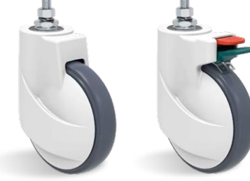
GLNE 150 UPE GLNE 150 UPE DA