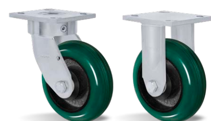
GKSr 62 ACE FKSr 62 ACE