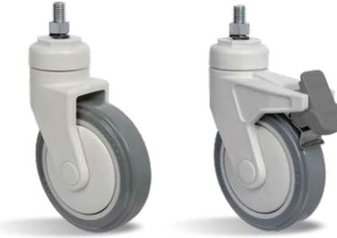
GNRE 412 BPE GNRE 412 BPE FP