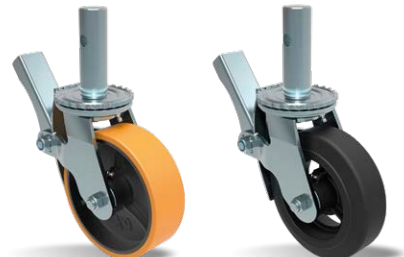
GCAEL 62 PR FP GCAEL 62 BR FP