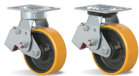
GCSX 62 PE GCS 62 PE