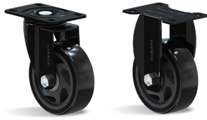
GLA 412 BPE ONIX FLA 412 BPE ONIX