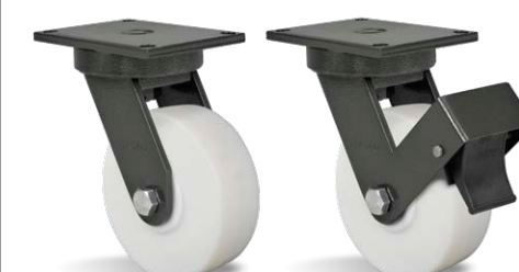
GPX 63 NME GPX 63 NME FP