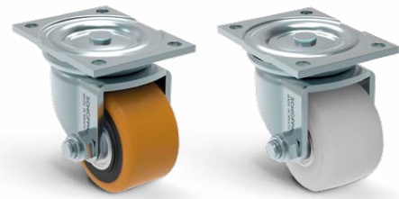
GMW 316 PE GMW 316 NTE