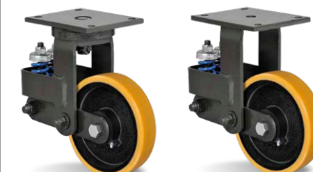
GCMX 82 PE FCMX 82 PE