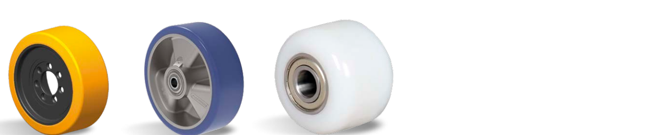
MONTACARGAS ELÉTRICAS ARES RCNT 80