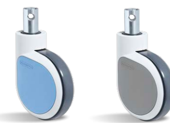
NEW AVTS 6 E32.50 G30 DF CAZ NEW AVTS 6 E32.50 G30 DF GCC