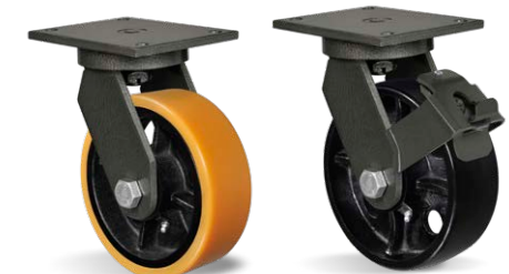
GMPX 83 PE GMPX 83 PE FPR