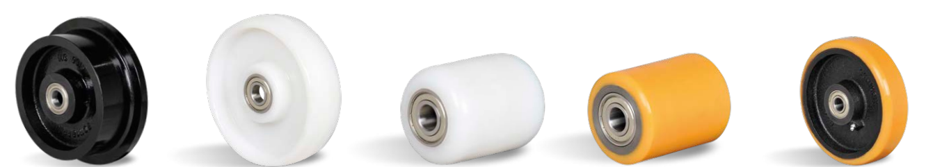
DVR RDNT (PALETEIRAS) RCNT (PALETEIRAS) RUC (PALETEIRAS) RUD (PALETEIRAS)