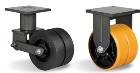
GDERX 124 BSE FDE 123 PE