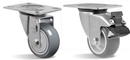
GL 312 BPE GL 312 BPE G