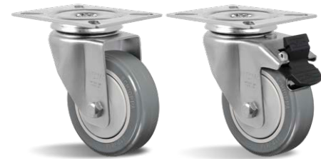
GL 414 BPE GL 414 BPE G