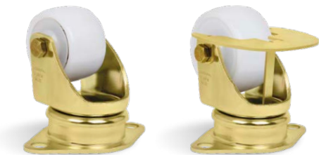
GLUP 314 NTE GLUP 314 NTE GC