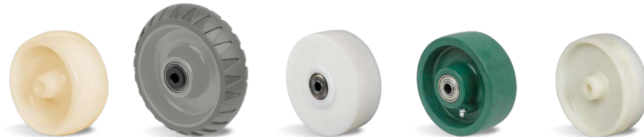
NTT Antimicrobiano STRE BPE NME NHT NFV