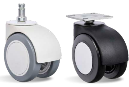
STG ELT 75 BP STC P55 75 BP