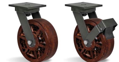
GPEX 124 CE GPEX 124 CE FP