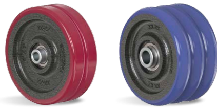
R 62 OPHE R 63 OPE AR