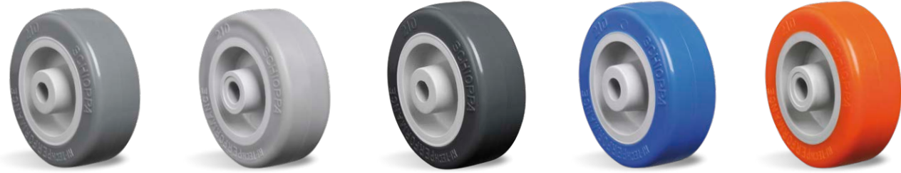
BP SP TB TP UP