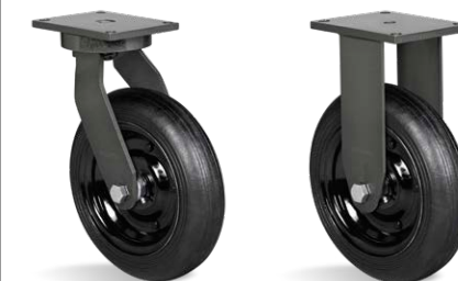
GPMX 2258 PMR FPMX 2258 PMR