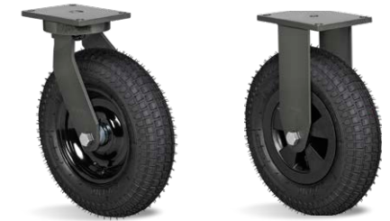
GPCX 3508 PCR FPCX 3508 PPR