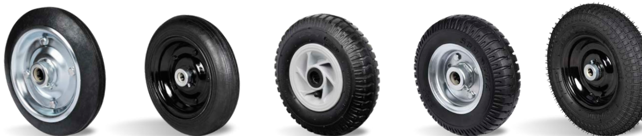
CHAPA ESTAMPADA NEUMÁTICO MACIZO RIT PPN RIT PCR NEUMÁTICA