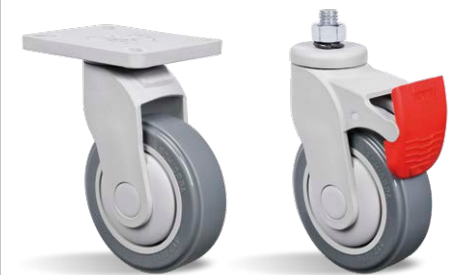
GN 312 BPE GN 312 BPE FP