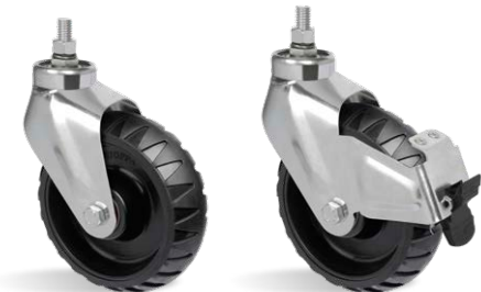
GSTRE 62 STRE GSTRE 62 STRE FP