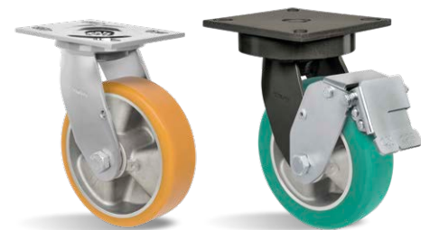
GS 82 ALPE GMX 62 ALPSE SOFT FPD