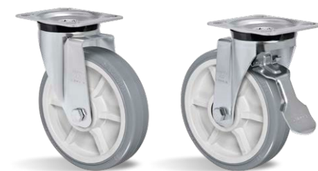
GSA 82 BPN GSA 82 BPN FP