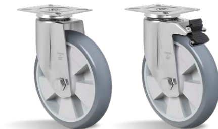
GL 816 BPN GL 816 BPN G