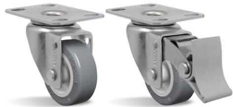
GL 210 BP GL 210 BP FP