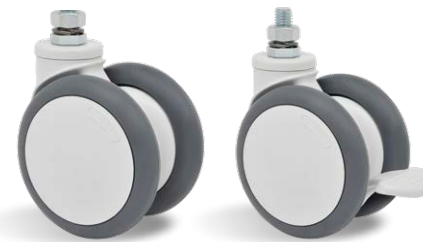
GD E12 100 TBE GD E12 100 TBE FP