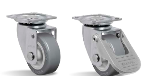
GLAP 210 BP GLAP 210 BP FPI