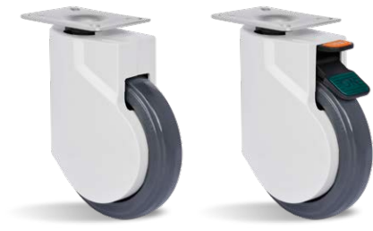
GHP 125 UPE GHP 125 UPE DA