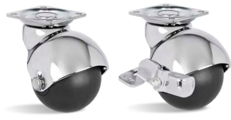
GLBP 210 NP CR GLBP 210 CR NP SL