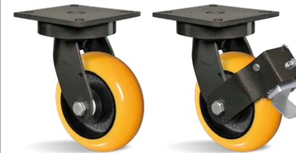
GMX 62 BCE GMX 62 BCE FP