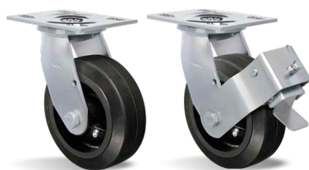
GS 62 BE GS 62 BE FP