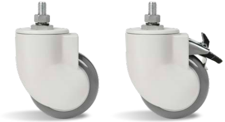
GLE CGE 412 BPE ROUND GLE CGE 412 BPE G ROUND