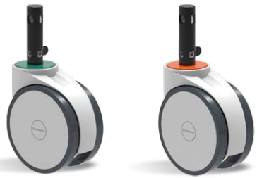
NEW AVTD 6 UPE E28.100 G30 DF NEW AVTD 6 UPE E28.100 G30 FT