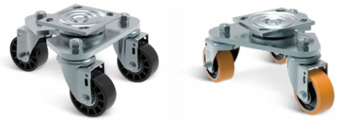
TRIPLEX S 312 NTE ITT TRIPLEX S 312 PE