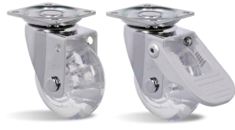
GLAP 210 GEL GLAP 210 GEL FPI