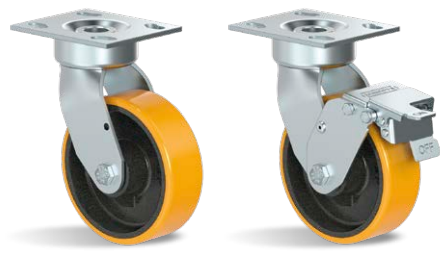
GSX 62 PE GSX 62 PE FPD