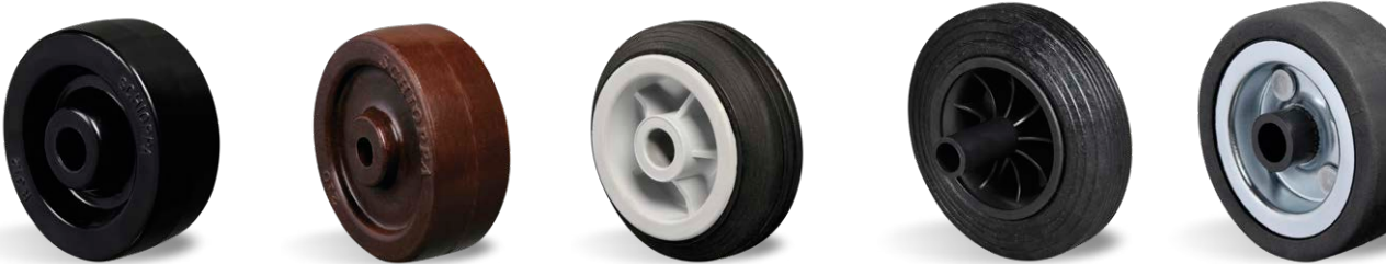
TM C BMN PMP (CONTAINER) BDN