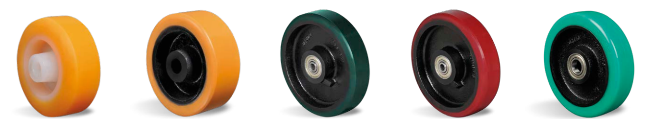
NU PN PAC PHP PU SOFT