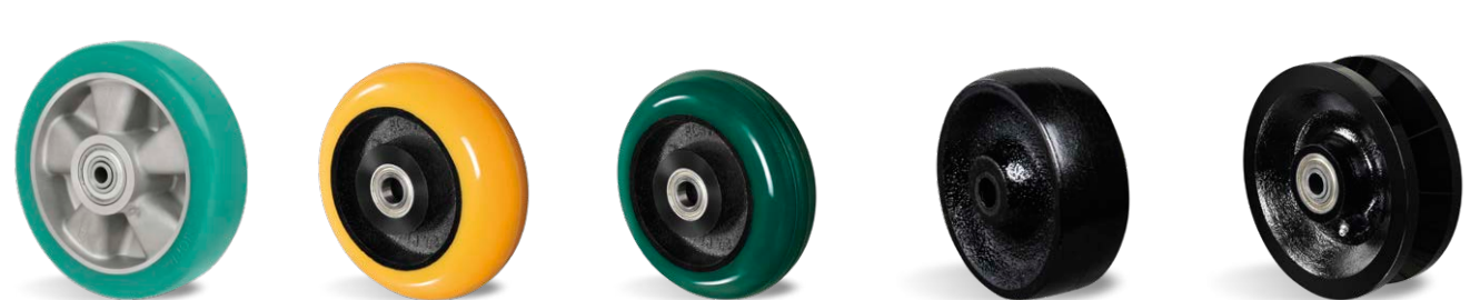
ALUMINIUM BCE ACE FN VR